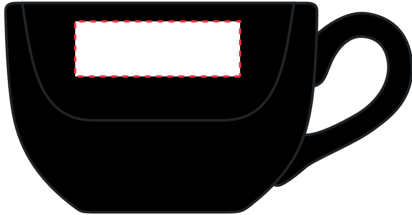
Binnenzijde: 45 x 15 mm