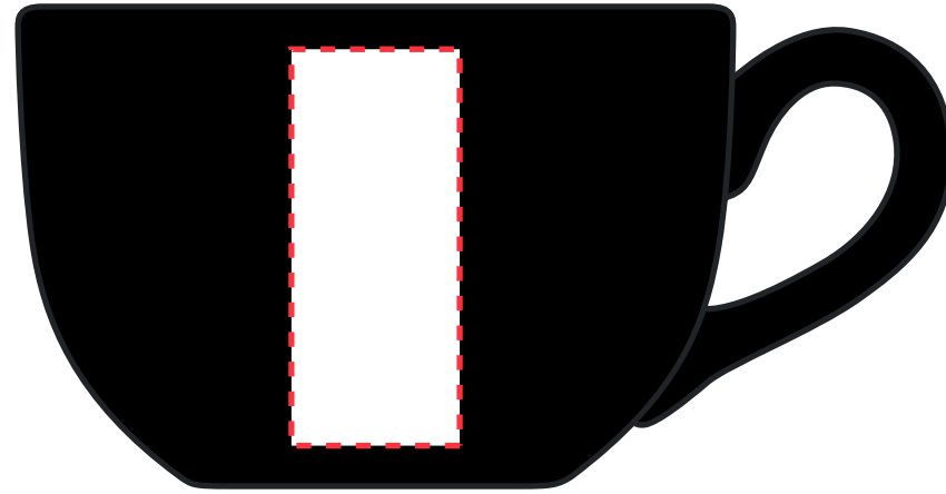
Lengtepositie: 45 x 20 mm